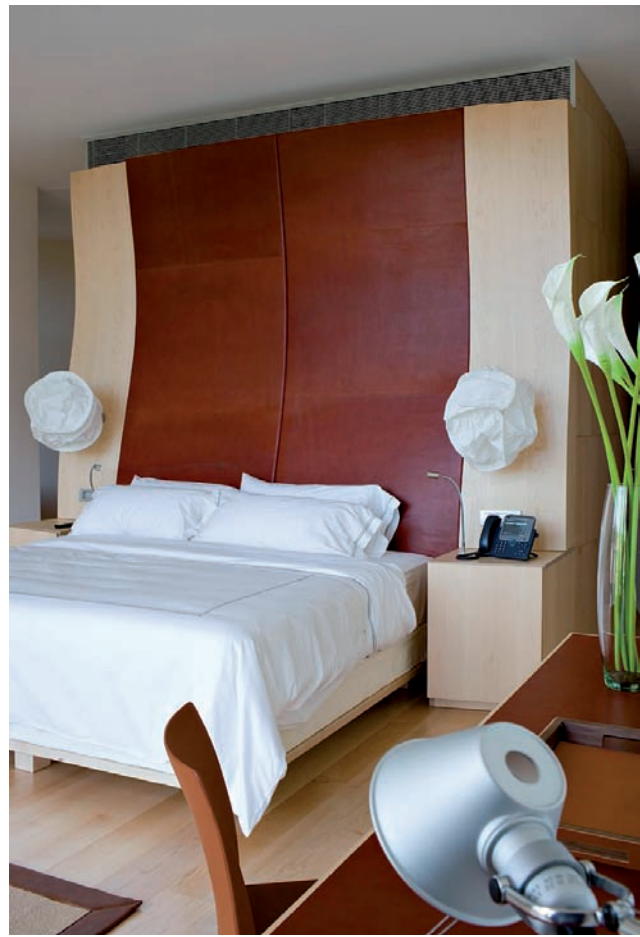
Arriba se puede apreciar la magnificencia del botellero de seis metros que preside el bar, y el cabecero realizado en cuero y madera de arce. La fotografía de abajo muestra un detalle del Spa, en la zona ampliada del edificio. ■ One can appreciate the magnificent bottle rack of six metres in height that presides above the bar, and the headboard made from leather and maple wood. The photograph below shows a detail from the Spa, from the expanded zone of the building. ■