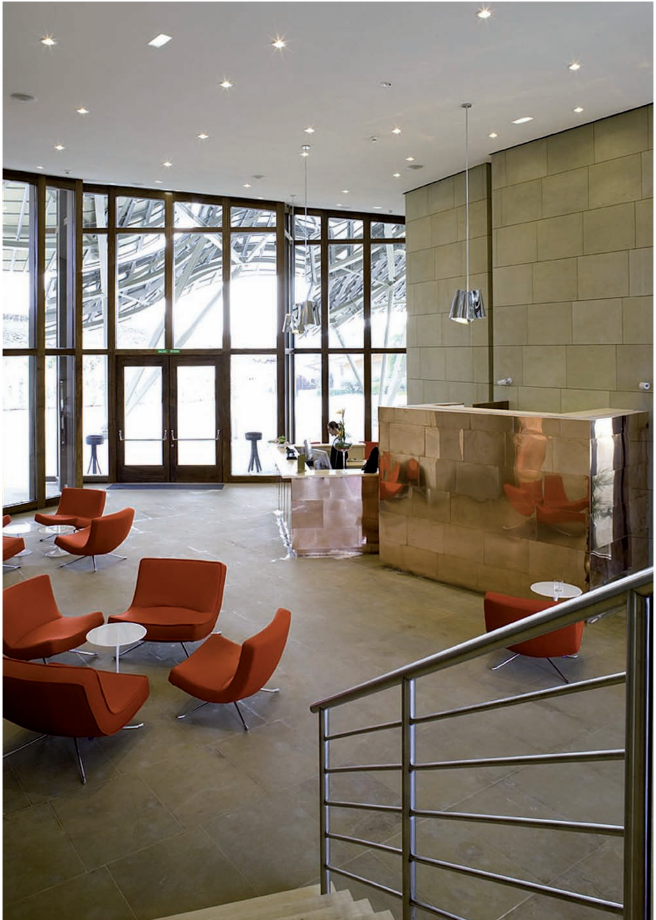
HOTEL MARQUÉS DE RISCAL. Vista del hall y la recepción./View from the hall and the reception.